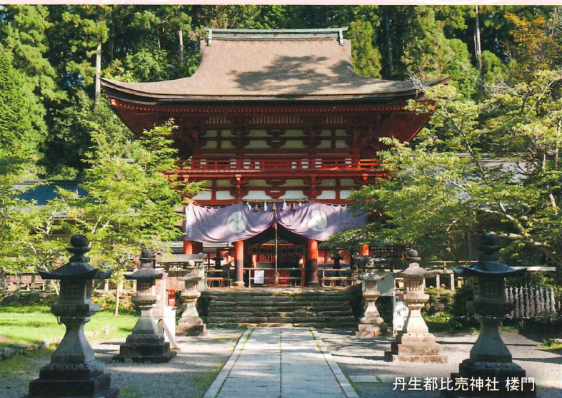
丹生都比売神社 楼門