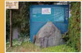
滝畑集落入口に多くの碑伝が置かれる中山王子跡がある