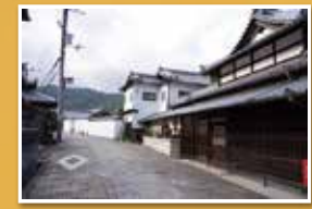
旧街道の風情を残す山中宿。道には石畳が敷かれている