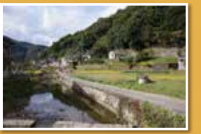
滝畑ののどかな風景を歩き春日神社(丹生明神)へ