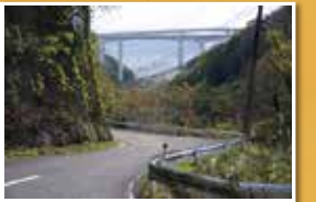
雄ノ山峠を越え和歌山市内へ。歩道がなく車に注意