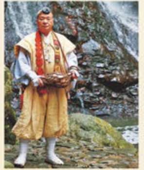
七宝庵寺の修験者の装束

修験者の装束は険しい山へ入って行くために、便利で動きやすい現代の登山服のような機能に加えて、仏の教えをさまざまな形で象徴するものになっている。装束を法衣、道具を法具と呼び、主なものとしては頭につける直径8cmほどの頭巾である頭襟、白衣の上から着る鈴懸、首から下げる結袈裟、手で持つ錫杖や合図などに使う法螺などがある。