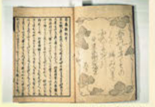
七宝庵寺所蔵の「葛嶺雑記」

幕末の嘉永3年(1850)に刊行された『葛嶺雑記』には、28の経塚やその拝所などが詳細に記されており、現代人が葛城修験を知る上でも大きな役割を果たしている。葛城修験は、明治時代初期の修験宗廃止令等により衰退し、修行を行った行場は自然に還り、そこに至る道も一度は廃れたが、戦後、再興しようとする動きが生まれ、『葛嶺雑記』等の書物を参考に、実地調査等を行い、経塚などの所在地を確定させた。現代のガイドブックのようなこの書物の存在が修験者にとっての道標となっている。