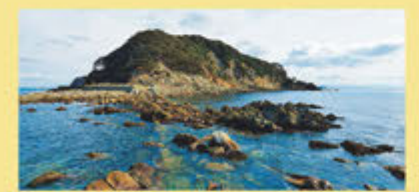
1番経塚のある友ヶ島の虎島

最初の経塚である「友ヶ島序品」は、山岳修行を行う修験道としては珍しく、和歌山市の加太沖に浮かぶ友ヶ島4島の一つ虎島にあり、普段観光客が訪れる沖ノ島から干潮時にだけ現れる岩場を歩いて渡る。友ヶ島にはじまる修験道は和歌山市加太へと続く。