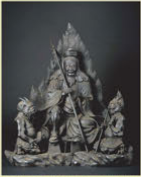
役行者像

修験道の開祖といわれる役行者は本名を役小角といい、7~8世紀にかけて実在した人物とされている。役行者にまつわる数多くの伝説の中には、不思議な力を駆使して、空や野山を駆け巡り、鬼神を自在に操ったといった逸話も残されている。役行者が葛城修験を開いた後に移った修行の地が「大峰山」であり、修験者にとって葛城修験とともに重要な行場とされている。