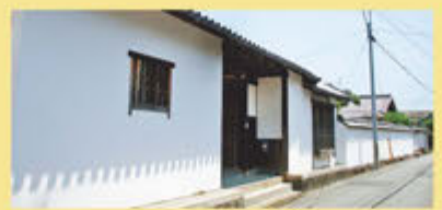
修行の休息地として利用された奥家住宅

葛城修験の地に連なる山々はさほど高くないことから、他の修験の地に比べて集落との関わりが強く、地域信仰とも深く関わってきたといわれる。修験の道周辺の集落には修験者たちを宿泊させるなどの役割を果たした「迎之坊」などがあり、修行の休息地として利用された大阪府泉佐野市の奥家などにも関連資料が残っている。