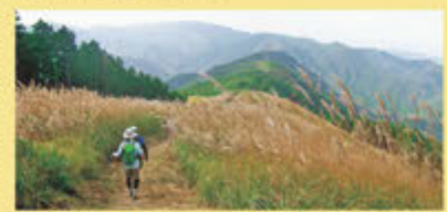
行場への道とリンクするダイヤモンドトレール

葛城修験では今も多くの修験者たちが修行を行う。修験道は道なき道をかき分け、崖をよじのぼり、沢を伝うなど過酷なものだが、一方で、行場のすぐ近くまで車の乗り入れができるなど、近年ではアクセスがよくなっているのも事実。葛城修験を知るために、まずは、美しい自然や文化、歴史と触れ合うことができる葛城の地を気軽に訪れてみることから始めてみたい。