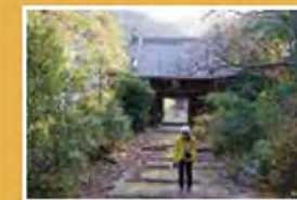
役行者の母公の墓がある高仙寺。飯盛山の登山口