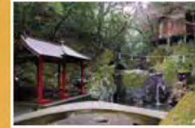
鳴滝不動尊の圓明寺。独特の神妙な雰囲気漂う