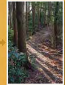
飯盛山と札立山をつなぐ尾根道。起伏が少なく歩きやすい