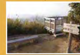
展望デッキが設けられた飯盛山山頂は大阪湾の展望台