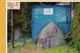
滝畑集落入口に多くの碑伝が置かれる中山王子跡がある