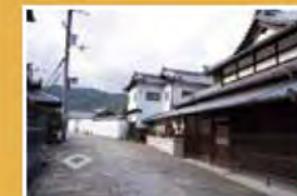
旧街道の風情を残す山中宿。道には石畳が敷かれている