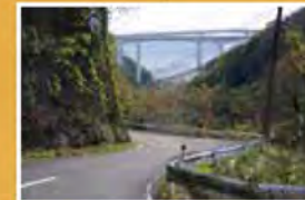
雄ノ山峠を越え和歌山市内へ。歩道がなく車に注意