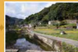
滝畑ののどかな風景を歩き春日神社(丹生明神)へ