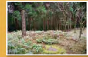
国指定史跡の高宮廃寺跡には礎石のみが残っている