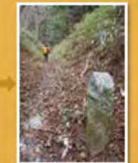
石寺跡は伏見道と合流し、伏見峠へ。丁石もある