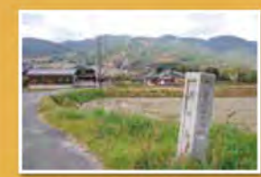
風の森から葛城の道へ。正面に金剛葛城の山並み