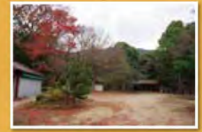
楠木正成の難攻不落の城、千早城跡から金剛山を見る