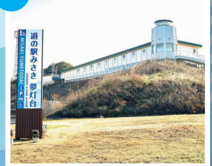
道の駅みさき夢灯台